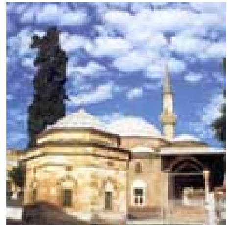
Gőlbahar Hatun Camii