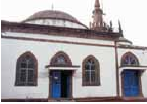
Ahi Ervan Dede Camii