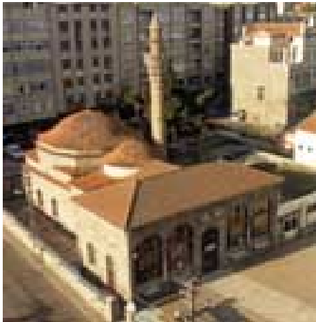
İskender Pařa Camii